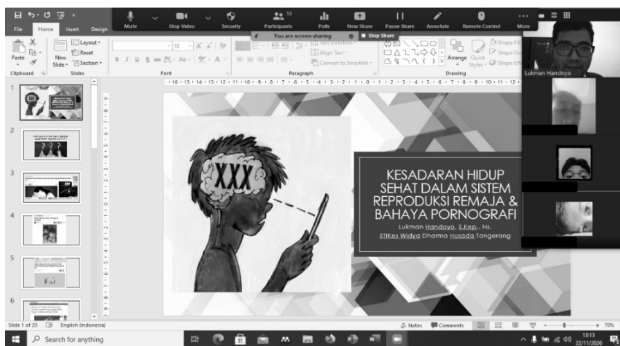
Gambar 1. Pelaksanaan Pengabdian Masyarakat Dalam Jaringan Saat Penyampaian Materi