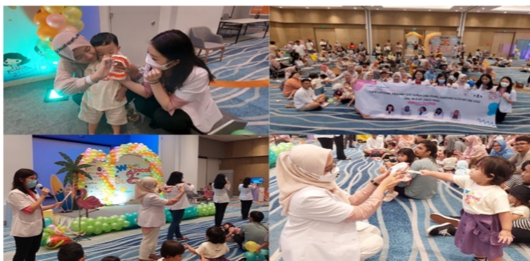
Gambar 3. Kegiatan Pelatihan