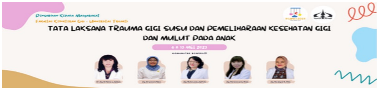
Gambar 1. Publikasi Kegiatan

mahasiswa program magister, 1 orang alumni dan 1 orang tenaga kependidikan. Kegiatan ini diikuti oleh 51 partisipan yang merupakan anggota dari komunitas Birth Club April 21. Publikasi kegiatan diunggah melalui media sosial komunitas (Gambar 1). Tingkat pengetahuan peserta dinilai dengan pre-test sebelum pelaksanaan penyuluhan dan post-test setelah pelatihan melalui Google Form. Skor hasil kemudian dibandingkan untuk melihat adanya perubahan pengetahuan sebelum dan setelah kegiatan.